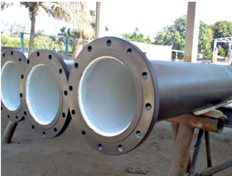
Recubrimiento anticorrosivo KSIR 88.

En México, existen miles de kilómetros de ductos instalados en distintos tipos de suelo y condiciones ambientales y de operación, empleados en la industria petrolera, los cuales requieren ser rehabilitados de la corrosión para garantizar su vida útil