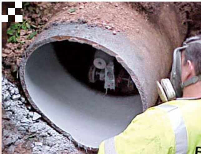
Recubrimiento interno, aplicación en campo.