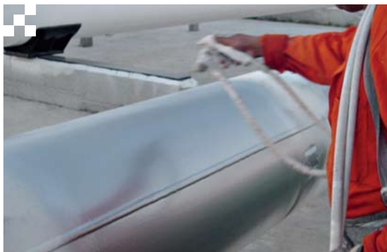
Recubrimiento Corro Tech 100% sólidos.

Existen productos en el mercado que a simple vista parecen ser muy buenos; sin embargo, suelen presentar “tremendas” fallas cuando se someten a pruebas, por ejemplo, el desprendimiento catódico, que es una prueba específica para evaluar recubrimientos para ductos.