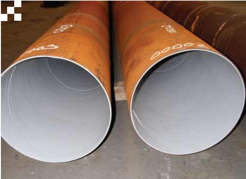
Recubrimientos anticorrosivos internos Hycote EP2306.