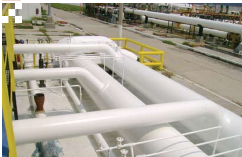
Recubrimiento Poly Nox base agua.

La selección del recubrimiento deberá considerar además: resistencia al stress del suelo, al desprendimiento catódico, absorción de agua y permeabilidad, desempeño a alta temperatura y al impacto, adherencia y flexibilidad, entre otros.